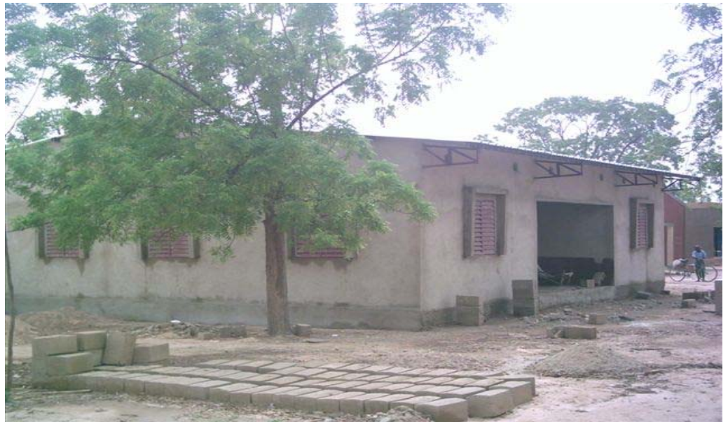
L'annexe à la maternité au 10 Juillet 2006

C'est avec un plaisir énorme que nous pouvons désormais affirmer que le projet d'annexe à la maternité de Pissila initié en 2002 est aujourd'hui en passe de devenir une réalisation de l'association Solidarité Pissila .